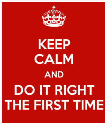
Figuur 1: DRIFT

Het betekent: Do It Right The First Time.